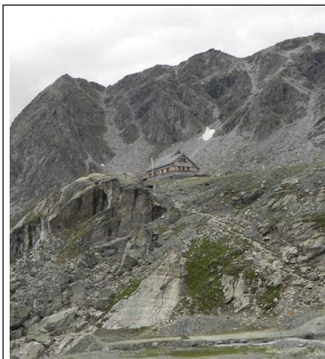
Cabane de Prafleuri

La descente du col ne présente pas de difficultés (pas ou peu de neige) et nous arrivons à la Cabane de Prafleuri vers 15hr15.