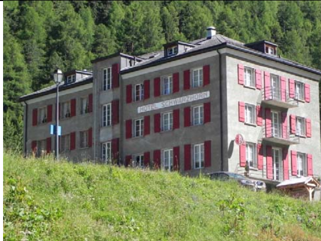
Hotel Schwarzhorn, Grüben.

Le parcours de cette journée nous permet un réveil plus tardif, à 7hr00, et nous partons à 8hr30 pour une balade à travers les alpages, direction est et sud-est pour retrouver le vallon qui mène au « Meidpass », le Col de Meiden. Nous remontons ce vallon vers le nord-est, faisons une pause au Lac de l'Armina (2565m), et nous arrivons au Col, 2790m, à 11hr05. Après 200m de descente nous nous posons aux bords du lac « Meidsee » pour une heure de repos et de pique-nique en tranquillité. Nous descendons en passant par le hameau d'Oberstafel (dégustation de bière et visite du chalet d'un suisse sympathique), et plus bas, au hameau de Mittelstafel, nous traversons un troupeau de vaches du Valais. A 15hr00 nous arrivons à Grüben, 1820m, et à l'hôtel Schwarzhorn.