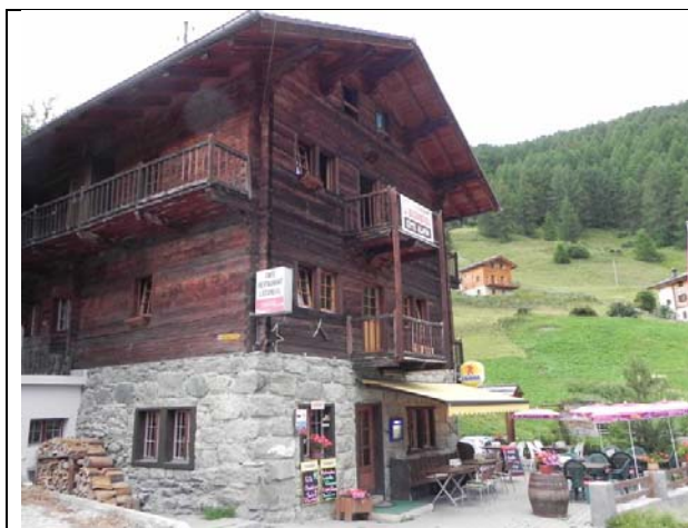
Gîte de l'Ecureuil, La Sage

Une descente de 50m nous permet de retrouver le petit lac sur le versant Est pour le pique-nique. Un sentier descendant direction nord-est par les alpages nous conduit au lieu-dit « Chemeuille », 2120m, vers le sommet du Télésiège de Chermeuille, qui nous amène 870m plus bas vers Lana 1400m, à moins de 2km à pied pour Evolène. Pause, repos, et courses pour prendre le bus à 18hr05 vers Les Haudères et La Sage, où se trouve notre Gîte de l'Ecureuil.