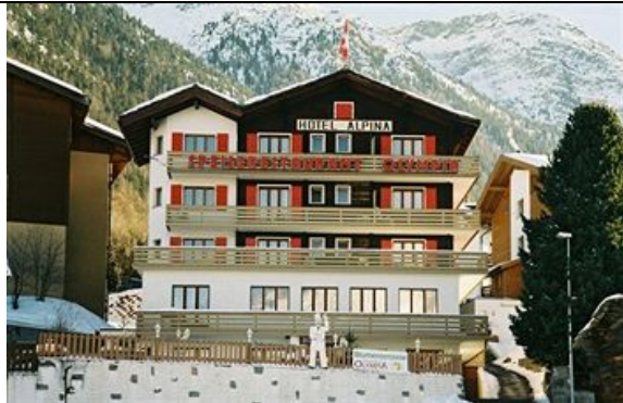
Hotel Alpina, Grächen.