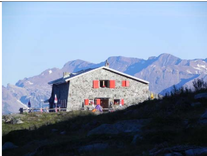
Cabane de Bella Tolla

Les bus nous amènent à Saint Luc, moyennant deux changement de ligne. La première à Grimetz, une heure et quart d'attente, ce qui permet de faire les courses et la visite touristique de l'ancien village, et la deuxième à Vissoie, 5 minutes pour le changement. Il y a du retard parce que le bus vers Saint Luc est bondé un minibus-taxi doit être affrété pour amener tout le monde. A Saint Luc il faut chercher les « passe d'Anniviers » qui nous permettent une montée gratuite (510m) par le funiculaire vers Tignousa, à 2186m. Il y a encore 150m à monter à pied pour arriver à la Cabane de Bella Tolla, 2350m, ou nous arrivons à 18hr00 et où nous sommes ce soir les seuls convives pour admirer la vue panoramique splendide.