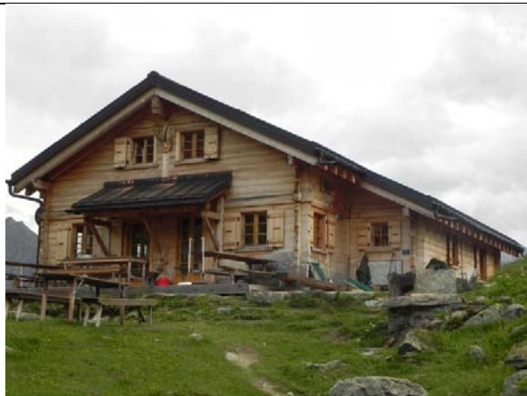
Cabane de Louvie

Départ de Briançon pour 300 km en voiture vers Fionnay, Val de Bagnes. Une voiture est garée à la gare terminus du train à «Le Châble ». Les autres voitures seront garées à Fionnay, en face du sentier qui nous mènera à la Cabane de Louvie. Après le pique-nique entre les deux petits lacs de barrage, nous entamons la mise en jambes par une montée de 745m, d'abord deux heures de pente régulière et continue jusqu'au « Plan du Tsenau », suivi par une demi-heure de montée plus modérée vers la Cabane où nous arrivons à 16hr15.