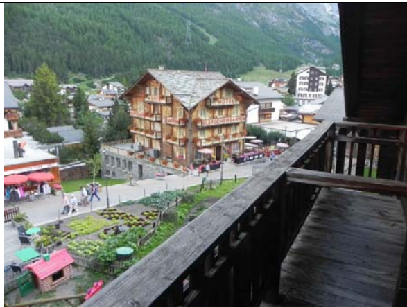
Gletschergarten & Edelweiss, Saas-Fee

Le réveil est tardif, sans se presser, parce que nous prenons les premières bennes de la télécabine qui montent à 8hr30 vers l'alpage de « Hannigalp », à 2122m. Commence alors, à partir de 8hr50, une longue traversée en balcon et en montagnes russes sur le « Höhenweg » qui nous amènera jusqu'à Saas-Fee. Ce parcours nous offre une grande variété de paysages et de points de vue, sur presque 21 km, oscillant entre 2100 et 2300m d'altitude. Nous passons plusieurs lieudits : Stock, Rote Biel, le torrent Schweibbach, un petit pré de déjeuner dans une clairière, le Bochwang, et le tunnel sous le torrent du Biderbach. Vers 16hr30 nous arrivons à l'hôtel « Gletschergarten » à Saas-Fee. Notre logement se trouve dans un annexe de cet hôtel, le Gruppenunterkunft « Mountain-lodge Edelweiss ».